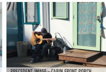
PRECEDENT IMAGE - CABIN FRONT PORCH