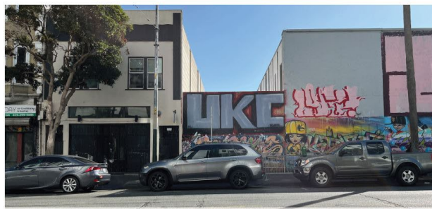
STREET VIEW ALONG MISSION STREET | BEFORE