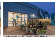
PRECEDENT IMAGE - DECK AND PLANTING