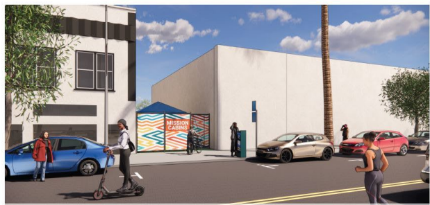
STREET VIEW ALONG MISSION STREET | AFTER