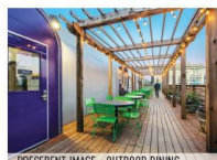
PRECEDENT IMAGE - OUTDOOR DINING