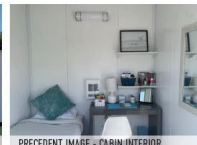
PRECEDENT IMAGE - CABIN INTERIOR