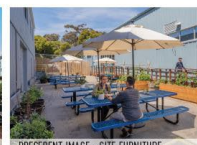
PRECEDENT IMAGE - SITE FURNITURE