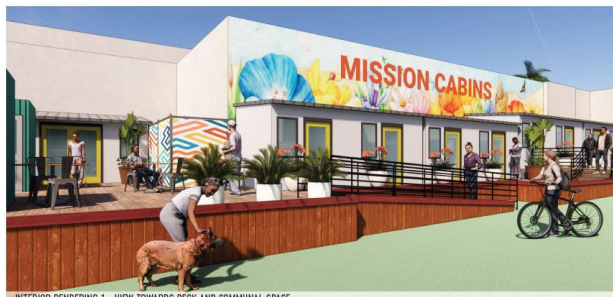
INTERIOR RENDERING 1 - VIEW TOWARDS DECK AND COMMUNAL SPACE

Abajo hemos proporcionado bosquejos y planos del diseño del lugar en 1979 Mission St.