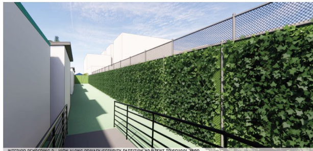
INTERIOR RENDERING 3 - VIEW ALONG PRIVACY/SECURITY PARTITION ADJACENT TO SCHOOL YARD