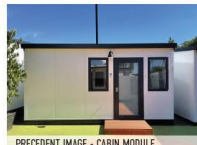
PRECEDENT IMAGE - CABIN MODULE