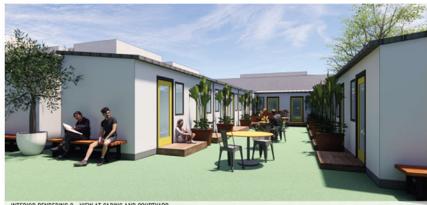
INTERIOR RENDERING 2 - VIEW AT CABINS AND COURTYARD